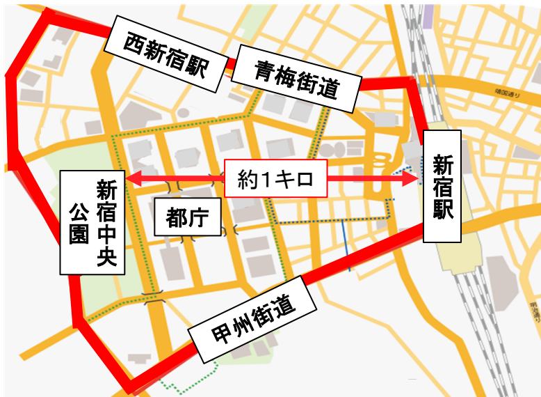
【西新宿エリア(赤枠内)】